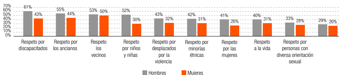
Gráfico 98. Porcentaje de hombres y mujeres que consideran que en Medellín hay buen comportamiento hacia las normas básicas de convivencia, por tema, 2018.