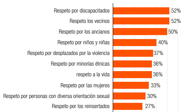
Gráfico 97. Porcentaje de personas que consideran que en Medellín hay buen comportamiento hacia las normas básicas de convivencia, por tema, 2018.